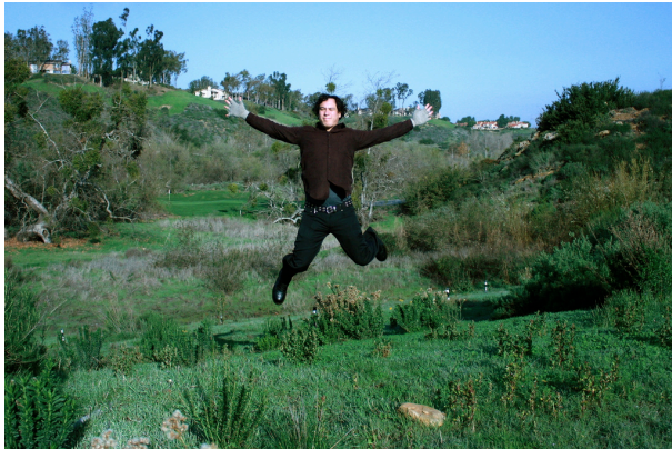
025:365 Might as well jump