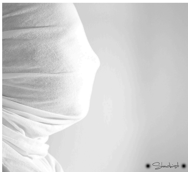
White out...305/365