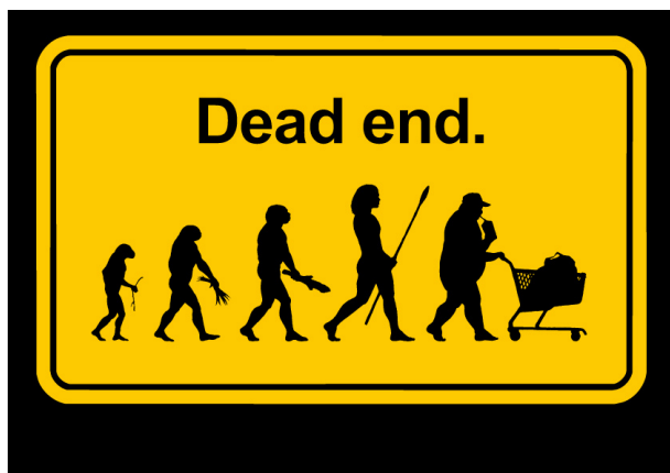
Dead end 2006