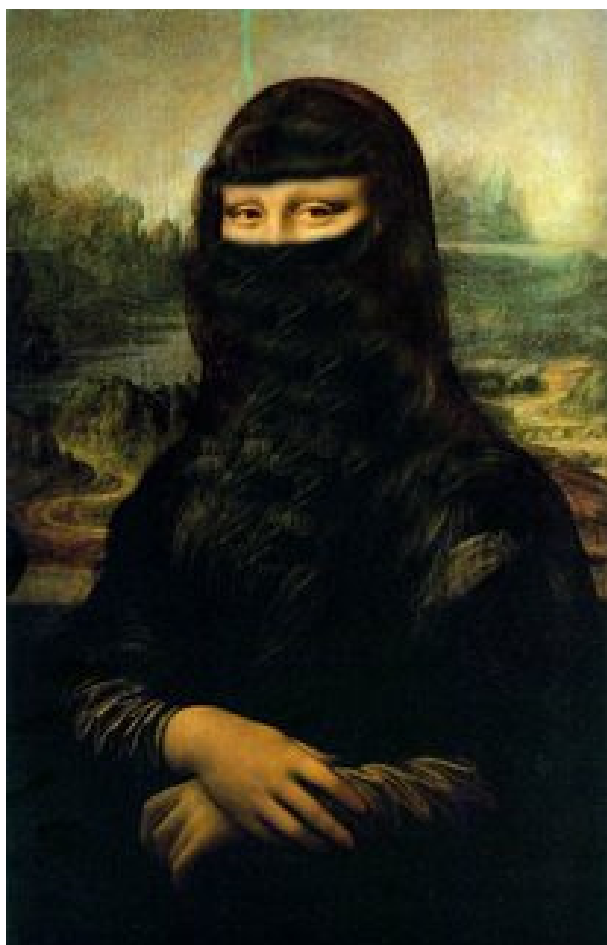
Mona-Lisa-Burka